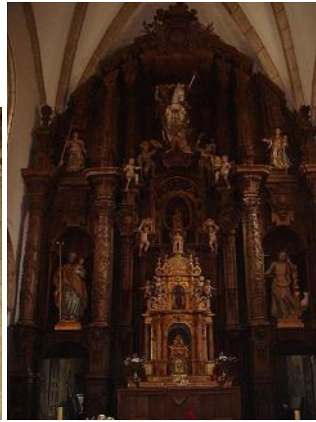
Retablo do altar maior de Santa María de Vilabade

A portada gótica de acceso é abucinada, con tres arquivoltas, capiteis vexetais e columnas entregas con baseamento elevado e individual. O tímpano, reducido, vai decorado con tres rosetas. Sobre a portada leva un beiril que descansa en modillóns con bustos humanos e un escudo cos tortiños ou roelas dos Castro e condes de Lemos. O rosetón superior é abucinado e con seis lóbulos radiais.