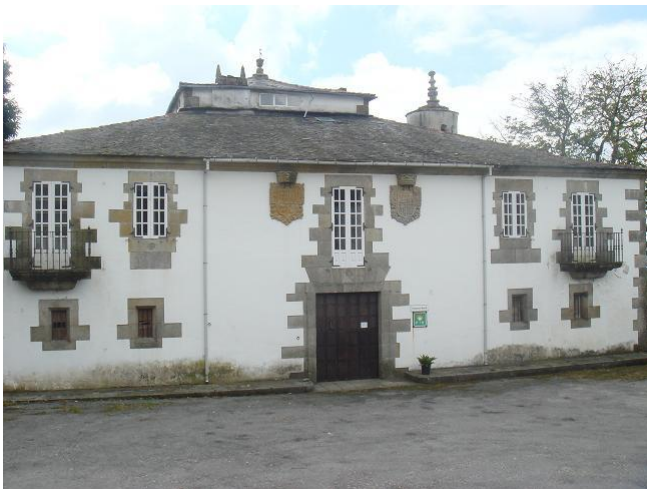
O pazo de Abraira – Arana con fachada brasonada.

O retablo maior é un interesante conxunto escultórico atribuído por algúns a Francisco de Moure aínda que parece comprobado que é obra de Francisco de Lens, de mediados do século XVIII, feito en madeira de castiñeiro nu, á cera e sen policromía, cun monumental sagrario dourado e presidido por unha imaxe de Santiago ecuestre.