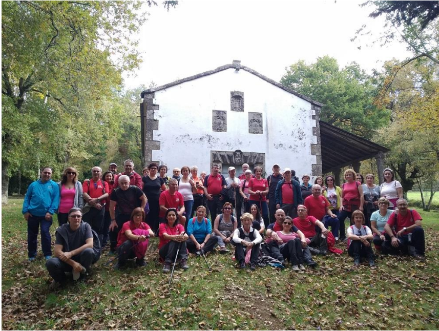
Da capela do Carme a Vilabade.