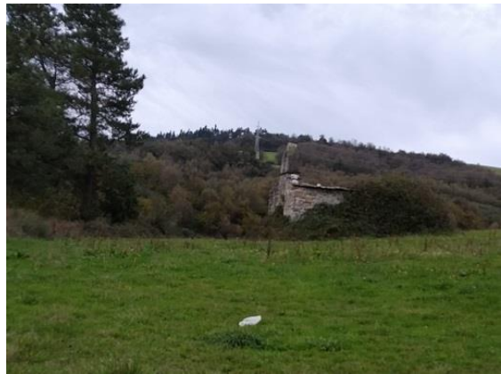
O Cádavo ao fondo