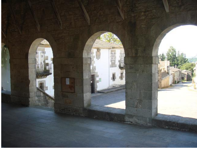
Vista da Praza e o Pazo desde o pórtico da igrexa